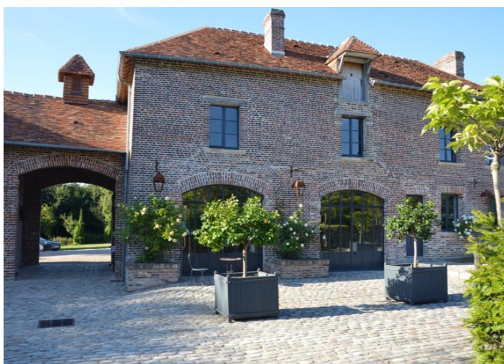
Une salle de présentation pour 25 personnes