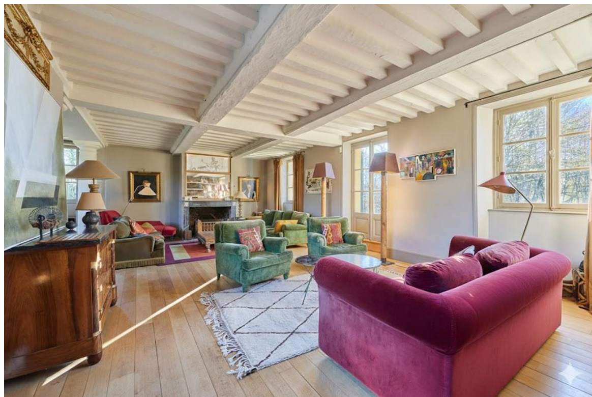
Le grand salon et sa bibliothèque, une ambiance maison de famille pour comex et comité de direction