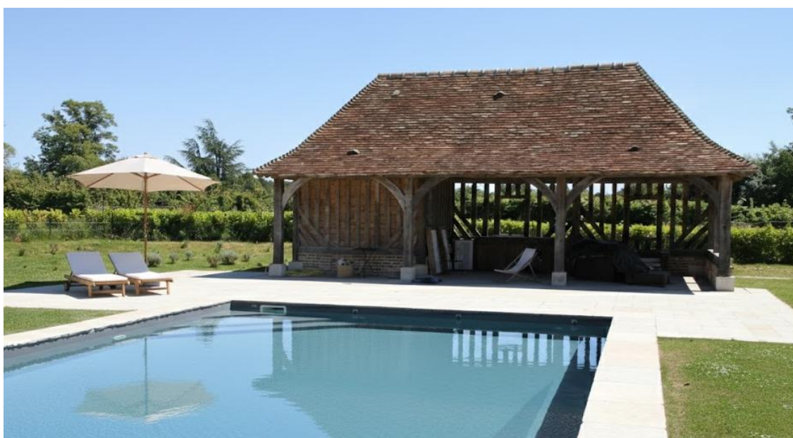
La piscine, les terrains de jeux au milieu d'un parc de 4ha. Il est aussi possible de visiter la chapelle du 16ème