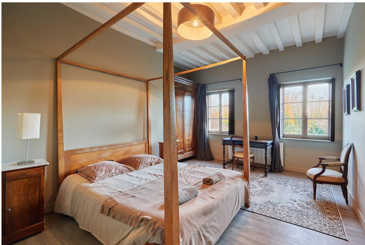
11 chambres, 6 salles de bains